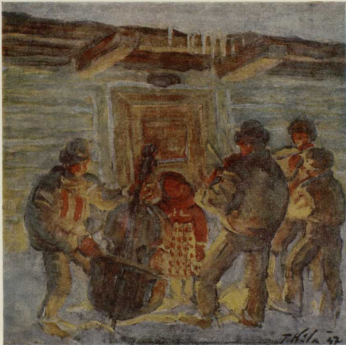
Ján Hála, Na viliju. Olej 1947