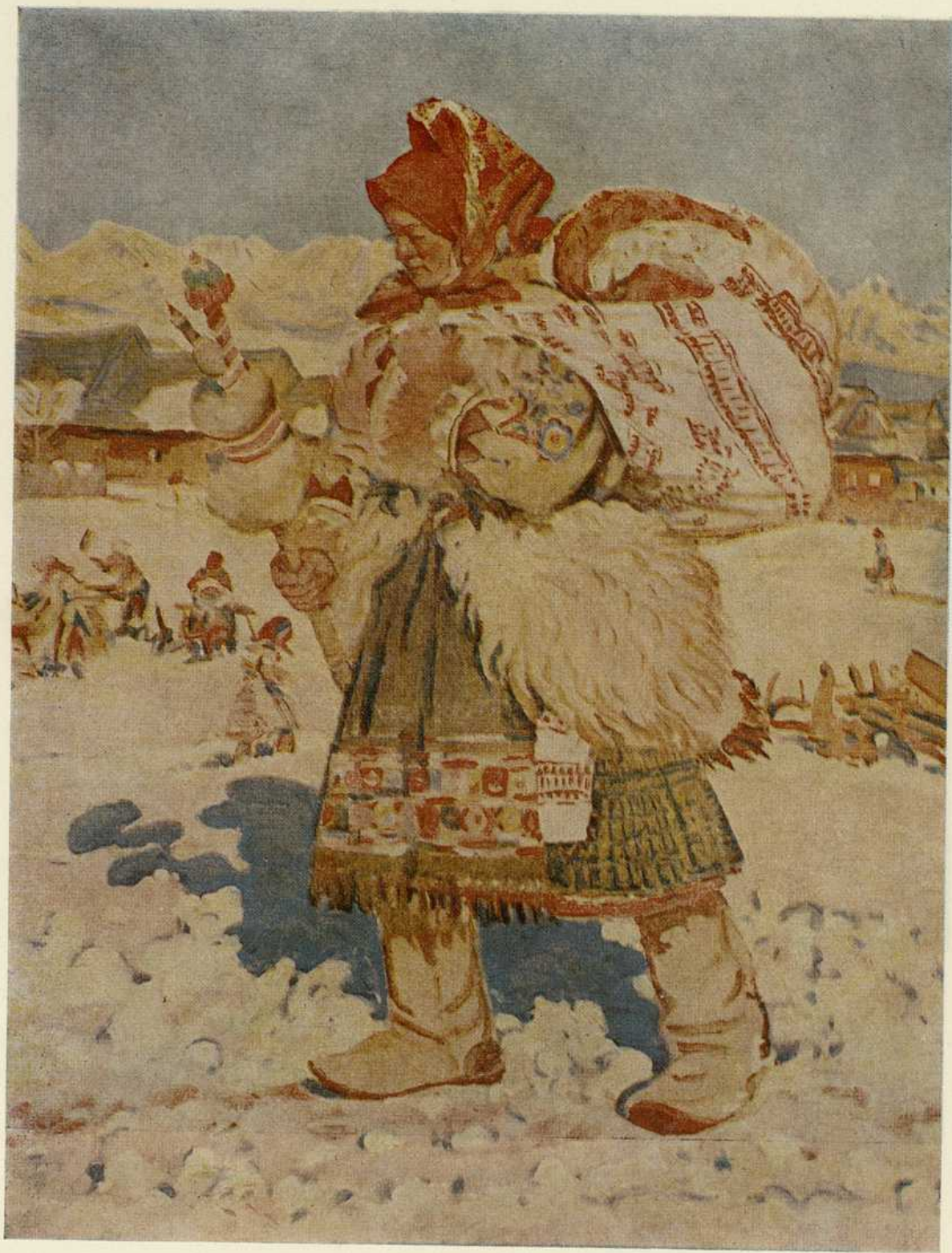
Ján Hála, Na priadky . Olej 1944