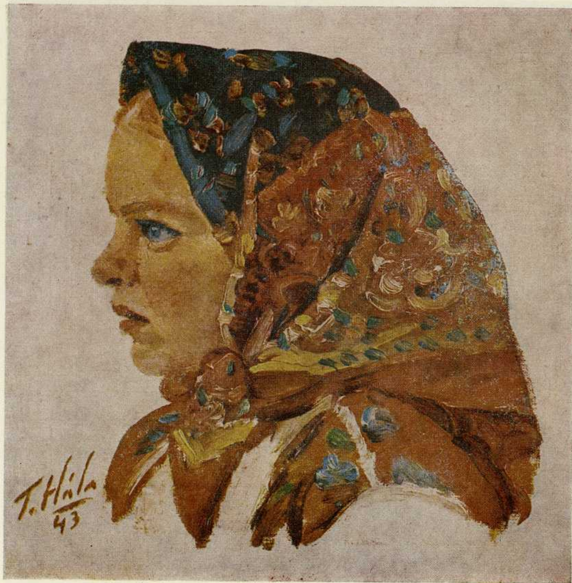
Ján Hála, Zuzka. Olej 1943