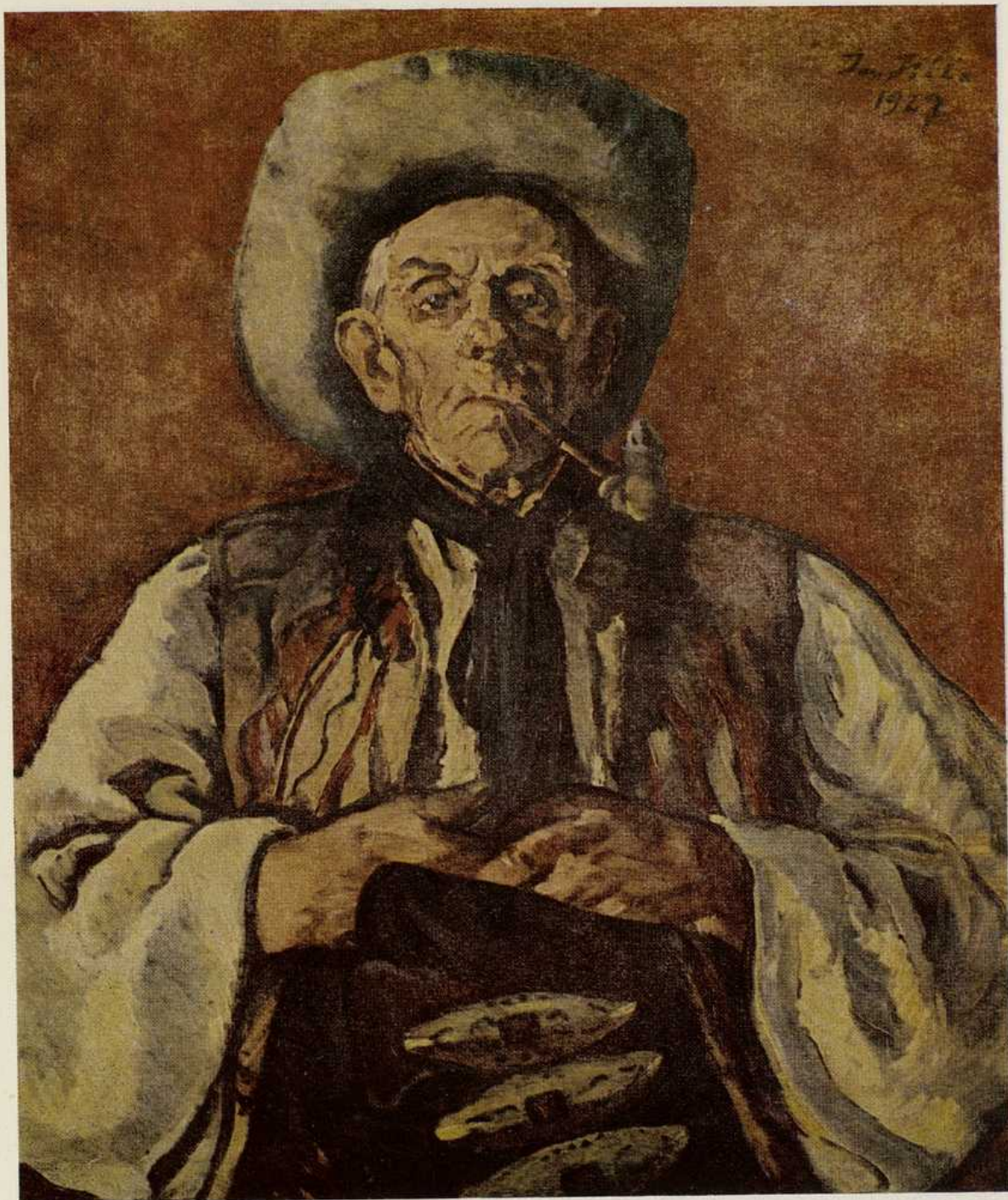
Ján Hála, Bača. Olej 1927