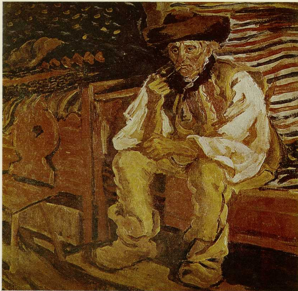
Ján Hála, Starý Važtan. Olej 1931