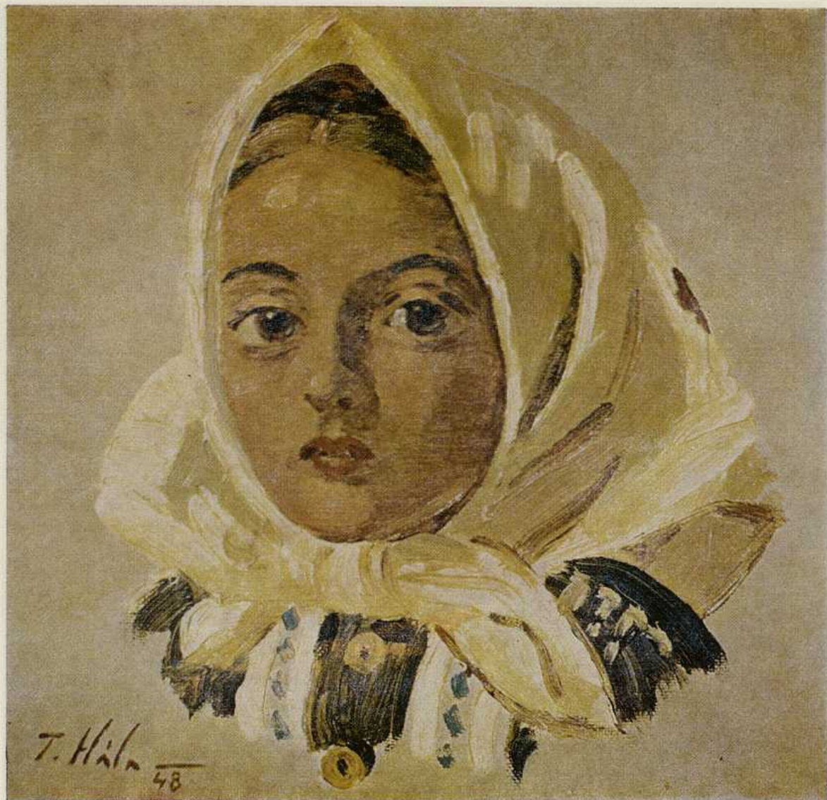
Ján Hala, Dievčatko. Olej 1948